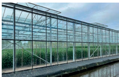
8 Verduurzaming en klimaat